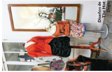
Diseños de The Hot Dogs.

Es una forma diferente para ver qué se está cocinando en el panorama artístico vienes y seguir sus tradiciones artesanales.