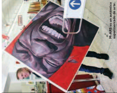
M-ARS es un auténtico supermercado de arte.