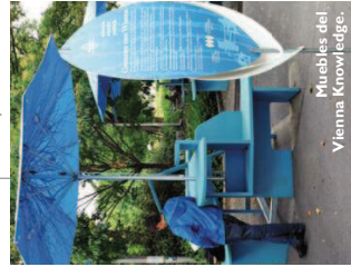
Muebles del Vienna Knowledge.

La ciencia o las nuevas tecnologías son algunos temas sobre los que puedes reflexionar en el Vienna Knowledge Space, un espacio habilitado para tal fin. En él, por medio de exposiciones, conferencias y debates se intentan conseguir vías alternativas para mejorar estos aspectos, que en ocasiones se centran en el área de la salud. El espacio cuenta con bar y un mobiliario urbano diseñado para este evento, que también está a la venta. La cita, hasta el 31 de octubre en Karlsplatz. Más información en www.k-space.at .